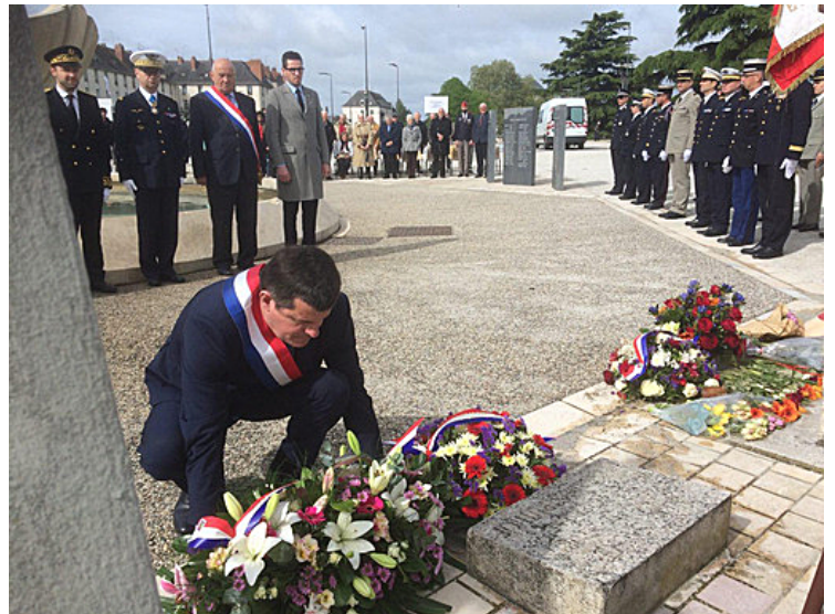
Journée du souvenir des victimes de la déportation 28 avril 2019

Par devoir envers ces femmes, ces enfants et ces hommes, cultivons la paix pour nous éviter de revivre le pire.