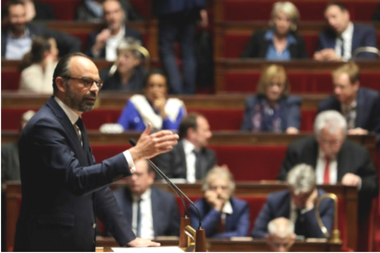
Edouard Philippe devant l'Assemblée nationale 9 avril 2019

La leçon de ce Grand débat, c'est que pour répondre à cette défiance, nous devons construire une démocratie plus délibérative, parce que le temps médiatique, le temps économique et le temps politique s'accélèrent, parce qu'on ne peut plus discuter de l'avenir du pays uniquement une fois tous les 5 ans.