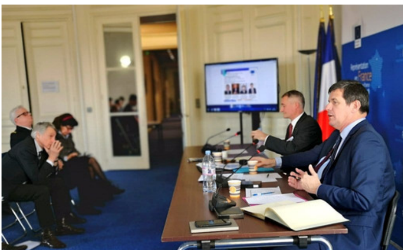
Conférence-Débat avec l'I.R.C.E. 20 février 2019

Son engagement nous honore. Son sacrifice nous oblige.