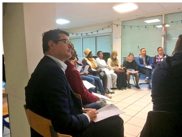
Débat avec Entraide & Solidarités 28 février 2019

À Tours, j'ai souhaité prendre pleinement part à la réussite de cette concertation, en ouvrant un cahier de doléances à ma permanence et en animant une série de débats avec tous les Tourangeaux qui souhaitaient s'exprimer.