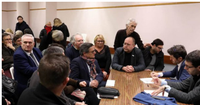
Débat aux Halles de Tours 4 février 2019

Avec cet exercice d'écoute et de démocratie participative, ce n'est pas changer la République dont il s'agit, mais bien de repenser notre modèle démocratique.