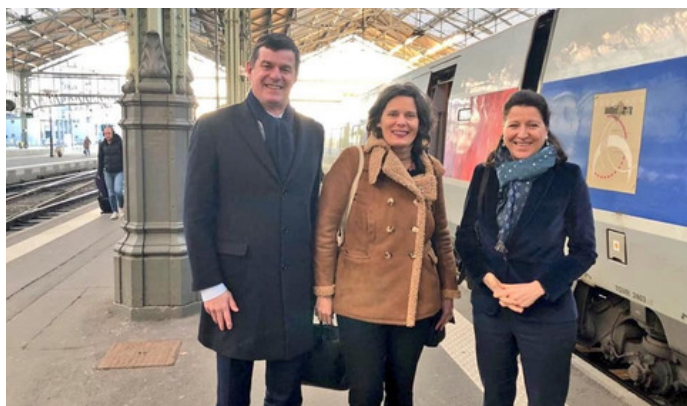
Agnès Buzyn à Tours 16 février 2019