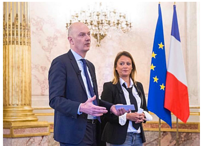
Roland Lescure et Olivia Grégoire 21 mars 2019

Le 21 mars dernier, j'étais très heureux d'accueillir à l'Assemblée nationale la Jeune Chambre Economique de Tours et sa présidente, Lise Pinault, pour Les Rencontres de l'Entreprise .