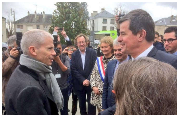
Franck Riester à Tours 15 mars 2019

Chaque année, les Assises Internationales du Journalisme rassemblent celles et ceux qui font de cette profession un engagement quotidien et ce tenant essentiel de notre démocratie.