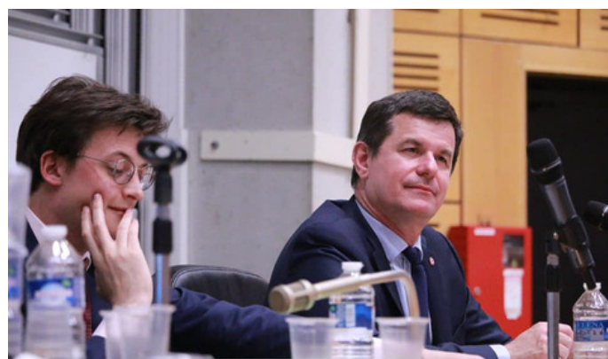
Sacha Houlié à Tours 28 mars 2019

Un débat de fond, qui met à l'honneur les nouvelles générations et leur attachement profond à notre Constitution.