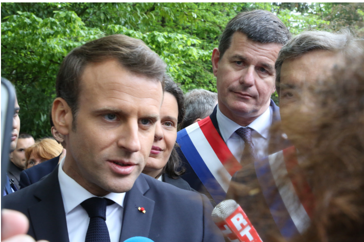
Emmanuel Macron à Amboise 2 mai 2019

C'est ce à quoi nous a invités depuis deux ans le président de la République. C'est ce qui fait que, venus d'horizons divers, nous sommes réunis autour de lui sur les bancs de l'hémicycle.