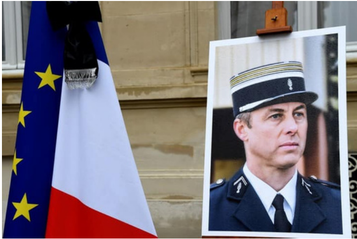
Hommage national à Arnaud Beltrame 24 mars 2019

Un an après, la France pense aux victimes de ce jour tragique où la tristesse et l'injustice ont frappé Trèbes et la France tout entière.