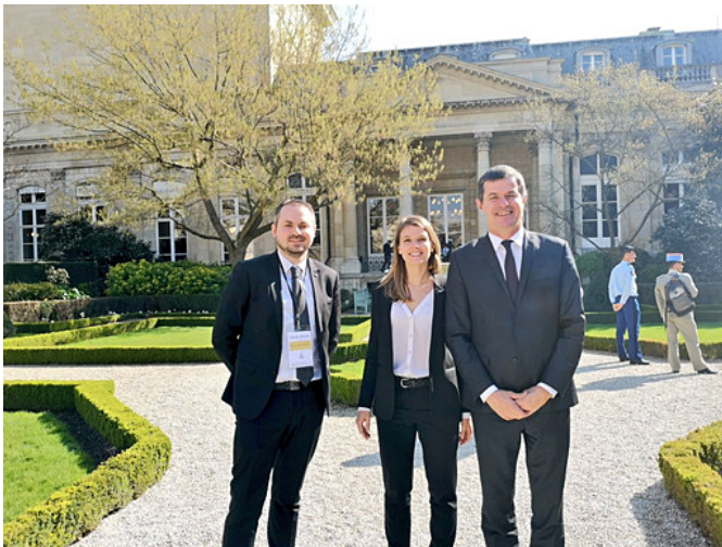
Les Rencontres de l'Entreprise 21 mars 2019