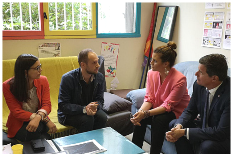
Entretien avec Marlène Schiappa et les bénévoles du Centre LGBTI de Touraine 25 avril 2019

Le 25 avril dernier avec Marlène Schiappa , nous sommes venus réaffirmer notre soutien actif pour son travail d'aide aux victimes ainsi qu'à l'ouverture de la PMA à toutes les femmes .