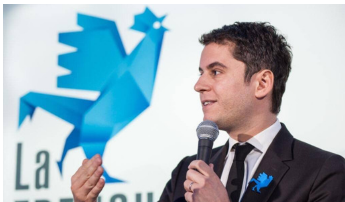
Gabriel Attal à Tours 2 avril 2019