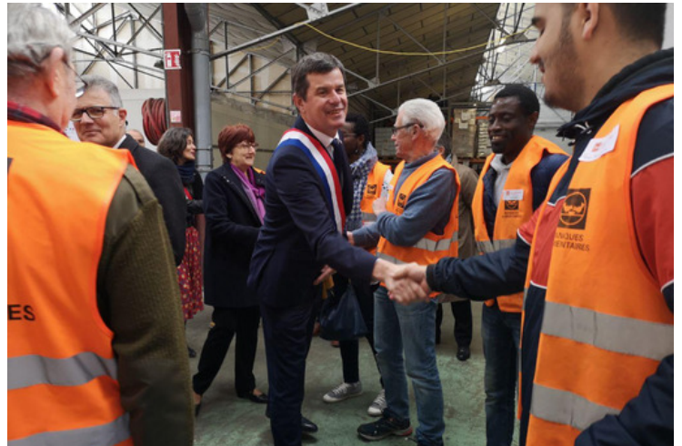
Inauguration des nouveaux locaux de la Banque Alimentaire de Touraine 5 avril 2019

Un investissement social inédit, pour faire plus pour celles et ceux qui ont moins.