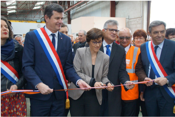
Inauguration des nouveaux locaux de la Banque Alimentaire de Touraine 5 avril 2019

Car oui, grâce à l'engagement et l'action remarquables des salariés et des bénévoles, ce sont plus de 1 000 tonnes de denrées alimentaires qui sont distribuées chaque année à nos concitoyens les plus démunis.