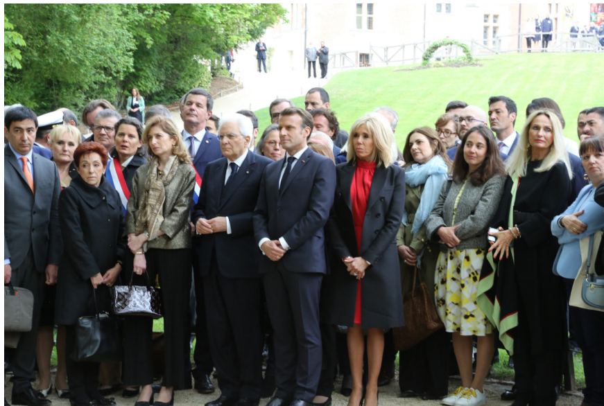
Le président de la République à Amboise 2 mai 2019

Le 2 mai dernier, sur les traces de Léonard de Vinci, Emmanuel Macron et son homologue italien Sergio Mattarella ont célébré l'amitié franco-italienne au Château Royal d'Amboise et au Château du Clos Lucé.