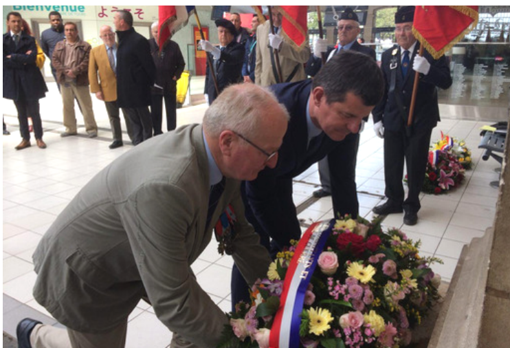
Commémoration du 8 mai 1945 7 mai 2019

Depuis 1949, l'entreprise publique est décorée de la croix de chevalier de la légion d'honneur.