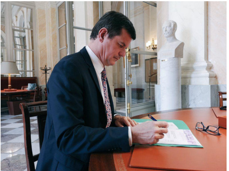
Salon Pujol de l'Assemblée nationale 27 mars 2019

À l'Assemblée nationale, j'ai souhaité y prendre part à travers quatre débats dans l'hémicycle, couvrant ainsi les grands enjeux de la Nation.