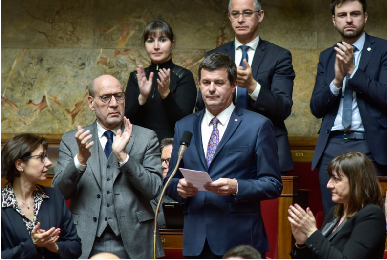
Séance de questions au Gouvernement 27 mars 2019

Le 23 mars dernier, le dernier kilomètre carré de ce qu'on appelait le « Califat » de Daech est enfin tombé.