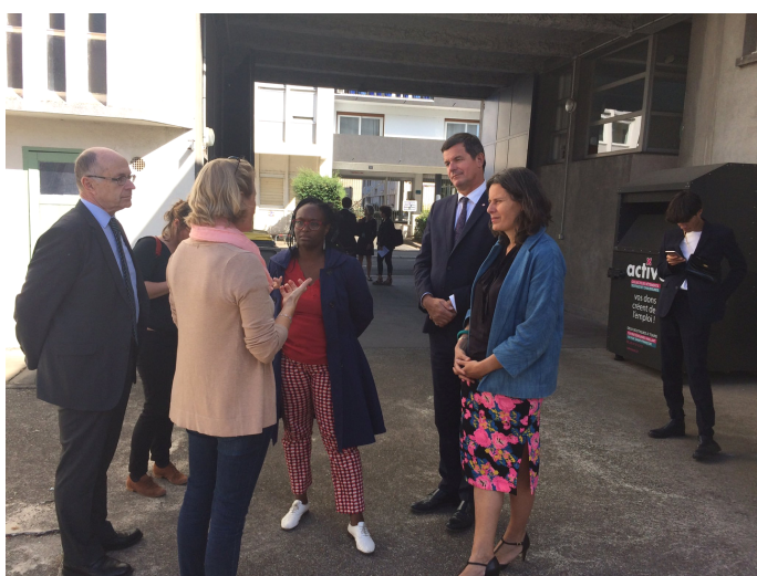
Sibeth Ndiaye à Tours 19 septembre 2019