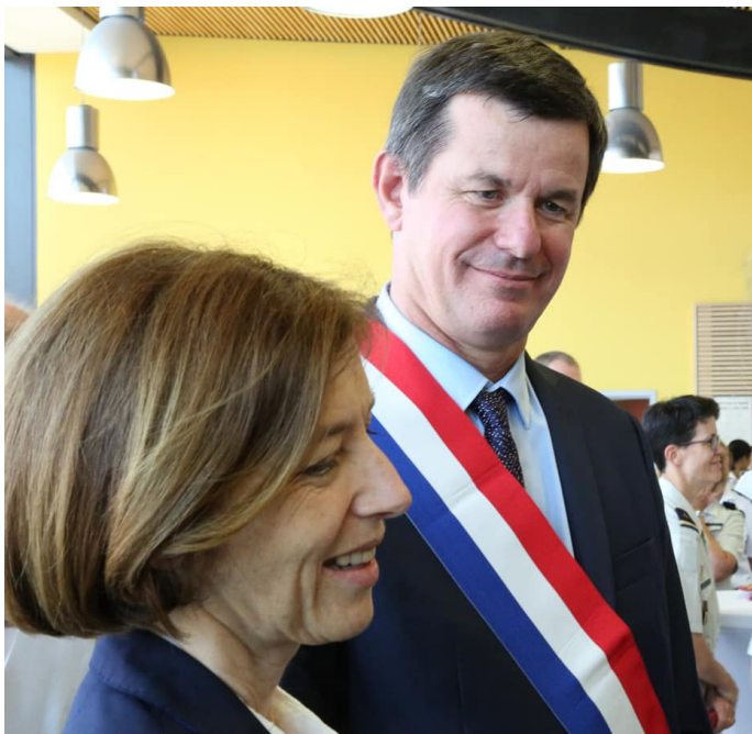
Florence Parly à Tours 19 juillet 2019