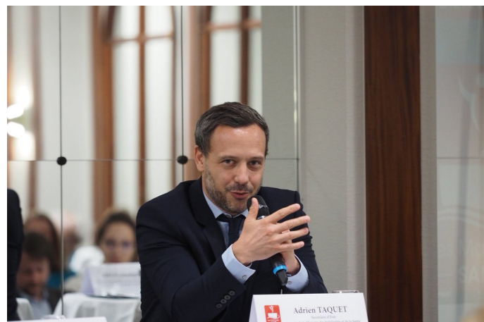
Adrien Taquet à Tours 11 juillet 2019

Tel est le message qu'est venu faire passer le secrétaire d'Etat chargé de la protection de l'enfance, Adrien Taquet, le 11 juillet à Tours, où nous avons répondu à l'invitation de la Mutualité Française Centre-Val de Loire puis visité l'Unité éducative d'activité de jour (UEAJ) Val de Loire.