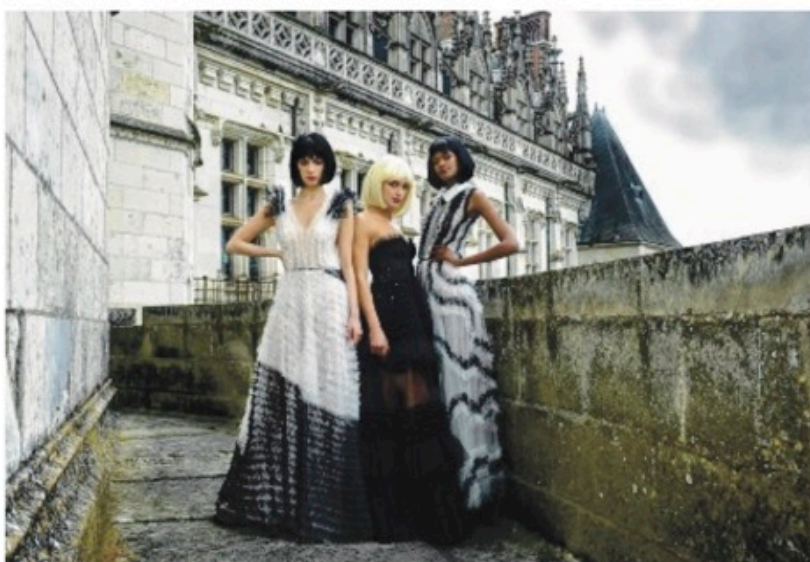
Le château royal choisi comme décor par la maison de haute couture « La Métamorphose ».

Toute l'équipe est arrivée le 2 juillet : maquilleuse, coif-