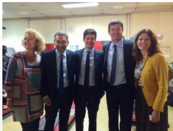
Un Secrétaire d'État en Touraine Julien Denormandie s'intéresse aux initiatives innovantes à Tours et Bléré

De retour à Tours, j'ai pu assister le soir de la Fête nationale au défilé des troupes, place Jean Jaurès.