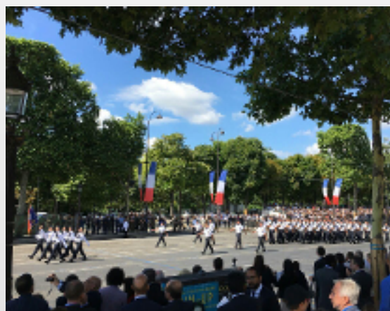
Cérémonies du 14 juillet

Le 5 juillet, j'ai participé à l'hommage de la Nation rendu à une femme d'exception par le Président de la République.