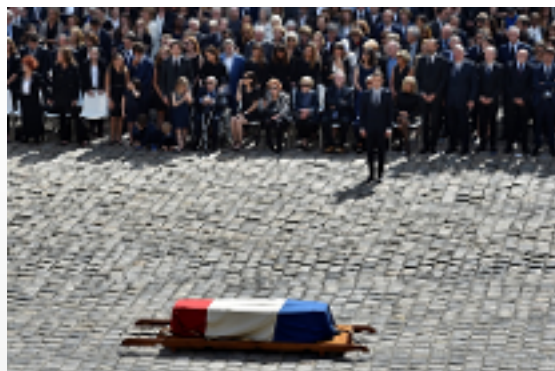
Disparition de Simone Veil La République en deuil

Le 5 juillet, j'ai participé à l'hommage de la Nation rendu à une femme d'exception par le Président de la République.